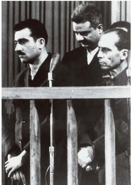
1965年5月9日,以色列间谍伊利·科恩(左)和两个身份不明的从犯在叙利亚首都大马士革接受审判,10天后科恩被处决

持续6天的战争,最终以以色列完胜告终。阿拉伯三国军队伤亡和被俘6万多人,以色列则为3100多人。通过战争,以色列一举占领了加沙地带、西奈半岛、约旦河西岸、耶路撒冷旧城和戈兰高地,领土面积超过6.5万平方公里,是其国土面积的三倍。与前两次中东战争一样,胜利并没有带来和平。1967年11月22日,安理会第242号决议确定了“以土地换和平”的方针,但该决议并没有得到有效执行,加沙、耶路撒冷、戈兰高地等问题至今悬而未决。战乱还致使50多万阿拉伯人沦为难民,很多人随时准备让犹太人血债血偿。仅仅7年之后,一场规模更大的阿以战争最终呼啸而来。 11