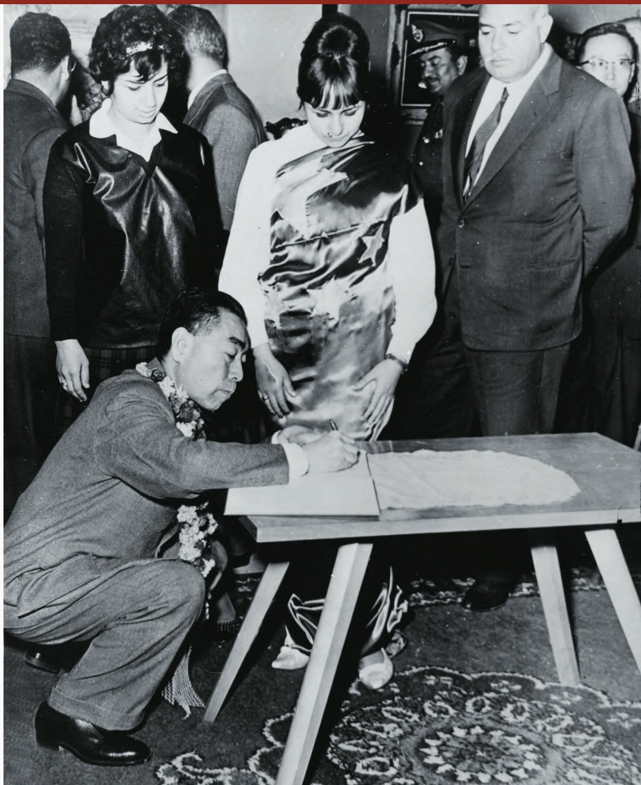
／ 1963年12月，周恩来在埃及访问期间，在首都开罗为埃及人签名留念

此次意外访问中，突尼斯总统布尔吉巴向周恩来赠送了一件铜镀金雕花盘，盘心花团锦簇，四周盘面由缠枝花叶构成，周围所镌阿拉伯文字意为：“信心是自由者的纽带”。金属工艺品是突尼斯的传统制品，也是游客必选的特产，其中以铜制品和金银制品最为突出，盘形装饰则是突尼斯家庭的常见摆设。