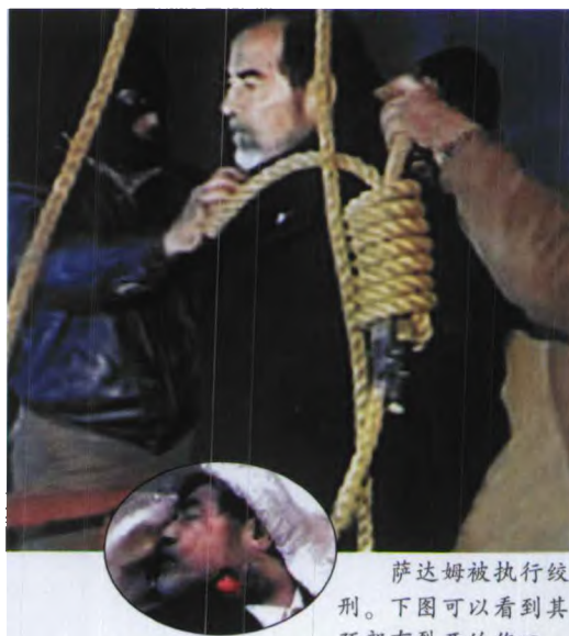
萨达姆被执行绞刑。下图可以看到其颈部有裂开的伤口。