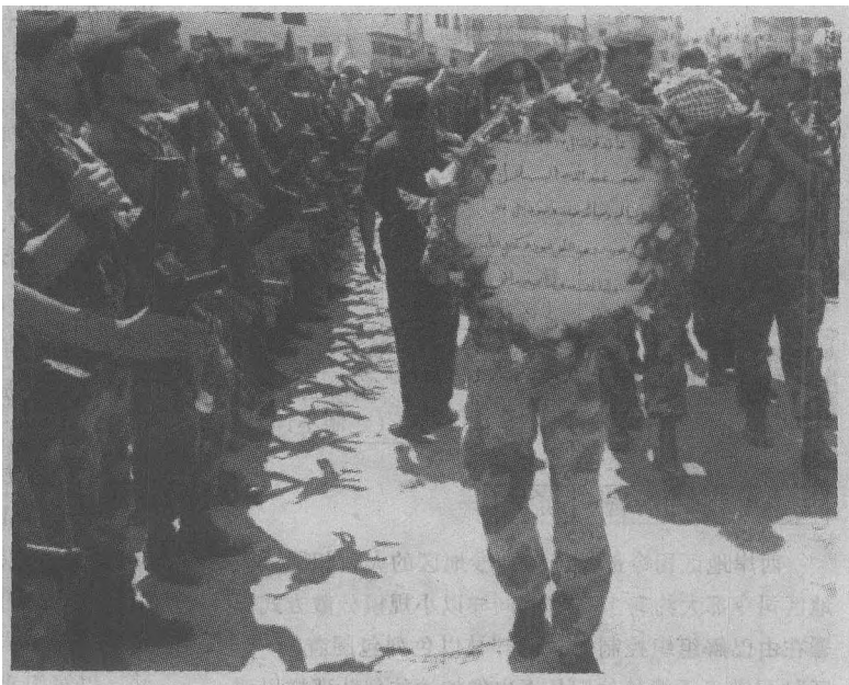
第17部队队员在为一名被以军杀害的同伴送行

然而1995年，在以色列城市发生了几起巴勒斯坦人自杀性爆炸事件后，巴以之间暂时的平静被打破了。阿拉法特感知到了政治危险，下令打击激进分子。在这项工作的初期阶段第17部队担当了主角。这时的第17部队编制又恢复到了3000人，而总指挥却变成了费萨尔·阿卜·沙拉赫上校，因为这时的纳托尔已经失去了阿拉法特的信任。由于担心无所事事的纳托尔会产生麻烦，所以阿拉法特任命他指挥新成立的特别安全部队，监督来自内部的反对活动和收集相邻国家对巴解政权进行颠覆活动的有关情报。纳托尔在新的岗位上没干多久，1995年又被阿卜·优素福·瓦西比将军替代。从此纳托尔的名字在公开场合消失了，在最近所有公开报告中都没再出现过。