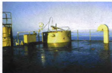
已被打坏的船首机枪

在技术上,如果“自由”号间谍船在离海岸视距外从事窃听活动,效果会降低80%。“自由”号间谍船为了窃听到超高频通信情报,没有理会以色列飞机的侦察飞行,仍在向加沙海岸靠近。6月8日5点15分前,以色列侦察机为判断该船的国籍和类型,至少进行了8次侦察行动,之后在“自由”号雷达屏上消失了。以色列侦察机起先以为该船是苏联的,这更加引起以色列的不安。10点,以色列出动的2架法制“幻影”Ⅲ型喷气式战斗/轰炸机向“自由”号间谍船飞来,并在“自由”号上空做了3次侦察飞行,进一步判断该船国籍和类型。“自由”号船员用望远镜可清楚地看到飞行员,但并没有意识到危险的来临,仍向加沙地带海岸靠近。10点30分至12点45分,“诺拉特拉斯”型侦察机又4次低空飞临“自由”号上空,进行最后的攻击前侦察。13点58分,在“自由”号雷达屏上发现有3艘水面舰艇以30节航速快速向“自由”号船尾靠近,与此同时在26千米外还有3架飞机从同一方向飞来。船员还以为又是一次侦察飞行,没想到战斗机飞到右