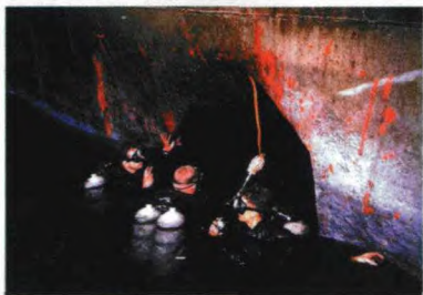
▲“自由”号船体被鱼雷炸开的大洞

空袭持续到14点25分才结束,此时3艘以色列鱼雷快艇也已抵达。“自由”号船整个驾驶台此时已被大火包围着,尾部的机枪射击台已燃起大火。船上的内部通信和一些传声筒已被飞机摧毁。鱼雷艇用信号灯向“自由”号发出“你是何船”的询问,而此时“自由”号船员还牛气十足地用信号灯反问以色列的鱼雷艇。以色列鱼雷艇艇长见“自由”号不报船名,赶紧翻阅阿拉伯海军舰船图册,发现该船与埃及的一艘运马船“埃尔·古赛尔”号相似,于是下令向“自由”号发射了5枚鱼雷,其中只有1枚击中目标。鱼雷将船体右舷中部扯开一个12米的大洞,若不是船员及时进行损管处理,船只将马上沉没。船体已开始向右舷倾斜9°。鱼雷爆炸使船丧失了动力,空袭击毁了应急发电机。