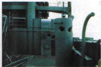
▲“自由”号上被摧毁的天线

在25分钟的空袭中,飞机摧毁了船上的无线电设备,使之无法发送求救信号。从空袭开始至14点03分结束,船上的6个舰岸通信线路中的5个被干扰,即使是国际求救信号频率也被干扰。船上的所有雷达天线和大部分无线电设备都被摧毁了,舰上的无线电人员临时修补了一个无线电系统,在火箭弹发射的几秒空隙赶紧发