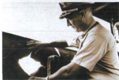
船长无耐地看着弹孔