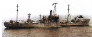
第6舰队对“自由”号进行救援

“自由”号受到攻击时, 船上共有294名船员, 其中有3名士兵通晓俄语和阿拉伯语。近期有报道指出, 该船当时执行的真正任务不是观察阿拉伯