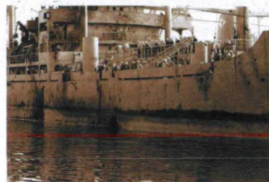
伤痕累累“自由”号到达马耳他

国家与以色列间爆发的战争, 而是以此为借口, 收集苏联停在亚历山大的图-95洲际轰炸机的行动情报。