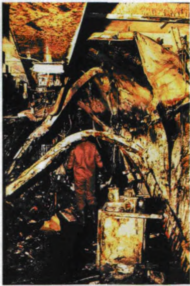
▲清理鱼雷爆炸后的舱室