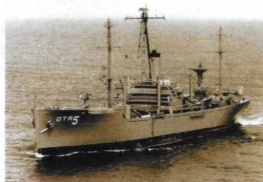
被攻击前的“自由”号间谍船

自从1948年以色列在美英的扶植下强行在中东建国以来,阿拉伯国家与以色列之间的争端更加频繁,美苏也开始在该地区扶植各自的力量。在1967年6月5日至10日,阿拉伯国家和以色列爆发了第三次中东战争,历史上又称六日战争。1967年6月8日,第三次中东战争熬战正酣,以色列为占领更多的领土,与埃及、约旦、叙利亚和伊拉克组成的阿拉伯联军打得难解难分。美国总统为掌握第一手的战区情报用于政治决策,派遣了美国海军“自由”号间谍船(AGTR-5)前往西奈半岛北部海域从事窃听活动。打红了眼的以色列,神经绷紧到了极点,不敢有半点闪失,为了自身安全宁可错杀美军,也不敢给阿拉伯联军一点取胜的机会,差一点将“自由”号击沉,造成船上美国海军士兵34人死亡、171人受伤。事后,以色列向美国解释说是把该船误认为是埃及的“埃尔·古赛尔”号运马船,将此事件解释为悲剧性的错误。美国从该地区的战略利益出发,为了不失去在中东亲自扶植起来的惟一的亲密盟友,并未采取复仇行动,而是命令船上的幸存者闭嘴,否则军法处置,企图将此事件掩盖起来。12年后,因“自由”号船上的幸存船员为了向美国政府讨个说法,此事才被捅了出来,然而美国政府至今仍掩盖着整个事件真相。本文将为您追忆“自由”号间谍船的中东死亡之旅。