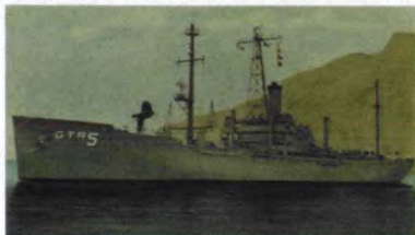
“自由”号间谍船侧影