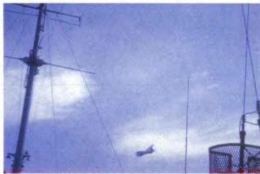
以色列侦察机进行攻击前低空侦察

第三次中东战争爆发前,美国海军“自由”号间谍船正在西非海岸从事窃听活动。5月24日,该船奉命速抵西班牙罗塔进行补给,然后以最快的速度前往加沙地带以西的西奈半岛北部水域从事窃听活动。“自由”号对外称作技术研究船,由“胜利”级货船改装而成,船上只装有4挺机枪。船