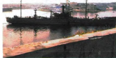
事后送到马耳他进行修理

25分, 编队指挥员命令“萨拉托加”号航母指挥官召回起飞的12架飞机。90分钟后, 即15点50分, 航母战机再次起飞想前往救援, 但又被美国防部长麦克纳马拉召回。美国为避免与盟友以色列发生冲突, 最终未敢派战机前去支援。