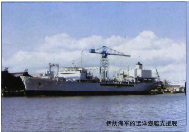
伊朗海军的远洋潜艇支援舰

其三是频繁举行实战演习,提升部队战备水平。自从伊朗核危机愈演愈烈以来,大规模军事演习便成为伊朗军队的“家常便饭”。在2006年伊朗就举行了3次大规模的三军联合演习,并在演习中试验了包括射程2000千米可覆盖以色列全境和美国在中东