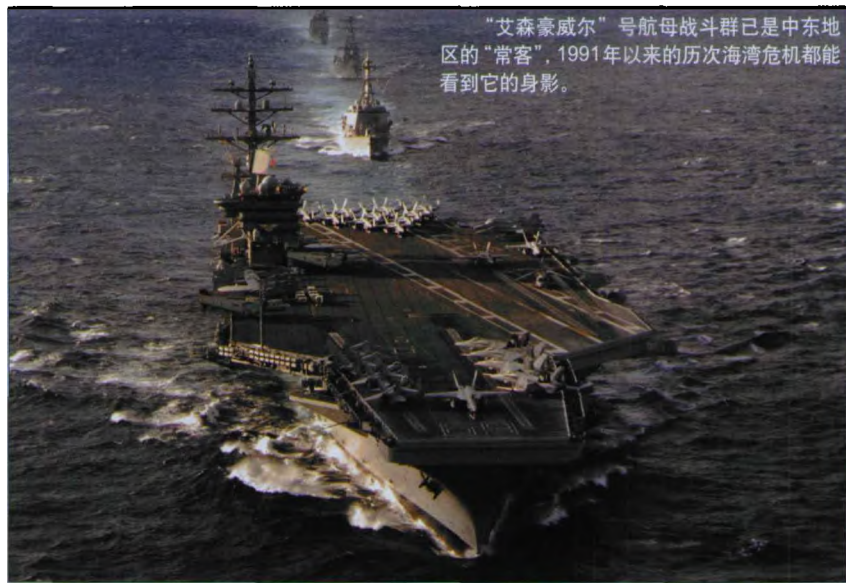
“艾森豪威尔”号航母战斗群已是中东地区的“常客”，1991年以来的历次海湾危机都能看到它的身影。

级两栖直升机攻击舰,以它为首的两栖打击群除“拳师”号外,还包括另外5艘大型战舰,6艘舰上共有6000人,其中包括第15陆战队远征部队的2200名官兵。此外,英国海军也向波斯湾地区派出多艘扫雷舰艇。这样的军事态势已经接近2003年伊拉克战争开战前美军针对伊拉克的军事部署。