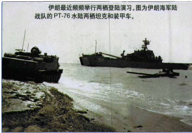
伊朗最近频频举行两栖登陆演习。图为伊朗海军陆战队的PT-76水陆两栖坦克和装甲车。

地区军事基地的“流星”-3型中程导弹和多种反舰导弹。进入2007年后,海湾地区的局势越发微妙,伊朗的军事演习随之更趋密集。1月21日至23日,伊朗革命卫队在首都德黑兰以东大约100千米处塞姆南省的加姆萨尔城附近举行了导弹攻击演习,演习中试射了“扎尔扎尔”(又译“闪动”)和“法基尔”-5(“曙光”-5)型近程地对地导弹,其目的是全面评估这些导弹的防卫与战斗能力。自2月7日开始另一场大规模海空军联合演习在伊朗南部地区及波斯湾、阿拉伯海上“打响”,为伊斯兰革命胜利日(2月11日)献礼。此次演习名为“霹雳”,旨在“提高导弹部队的防卫能力和战备水平”,虽然演习只有短短2天,但伊军刚成军服役的“道尔”-M1防空导弹系统以及美制“霍克”、英制“轻剑”系列导弹、俄制“米格”-29、美制F-14战斗机新旧武器都齐上阵,在演习中伊朗海军试射了射程达到350千米的反舰巡航导弹,防空部队的“道尔”-M1导弹则首次亮相参演。