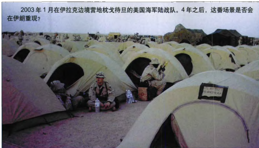
2003年1月在伊拉克边境营地枕戈待旦的美国海军陆战队。4年之后,这番场景是否会再在伊朗重现?

对于第三方中国来说,美国打击伊朗将使我国陷入两难的境地,这与在伊拉克的情形十分相似。我国素与伊朗保持着良好的关系,在伊朗有巨大的利益,尤其是石油利益。我国反对核扩散,但亦反对美国对伊朗动武,国家主席胡锦涛在今年初再次强调希望通过外交谈判妥善解决伊朗核问题,所以我国将力争通过外交手段阻止战争爆发。如若不能,我国理当不会支持美军的军事行动,然而由此我国在海湾地区的政治、经济利益将都受到严重冲击。就经济利益而言,不仅我国在伊朗的投资将化为泡影,而且战争将影响我国的原油进口,更为重要的是,动荡的伊朗且不论美国是否打跨伊朗现政权或扶持新美国的新政权,我国的能源进口安全都将受到威胁。所以战争不仅是伊朗、美国自身的噩梦,也将是世界的灾难。▲