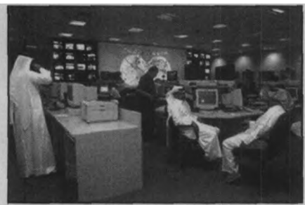
↑ 美国重视利用现代化的电视手段，主导和控制国际、国内舆论。图为目前惟一实现报道阿富汗局势的半岛电视台总部（设在卡塔尔多哈）。美国禁止国内主要电视台转播该台播放的本·拉丹及其同伴的讲话。