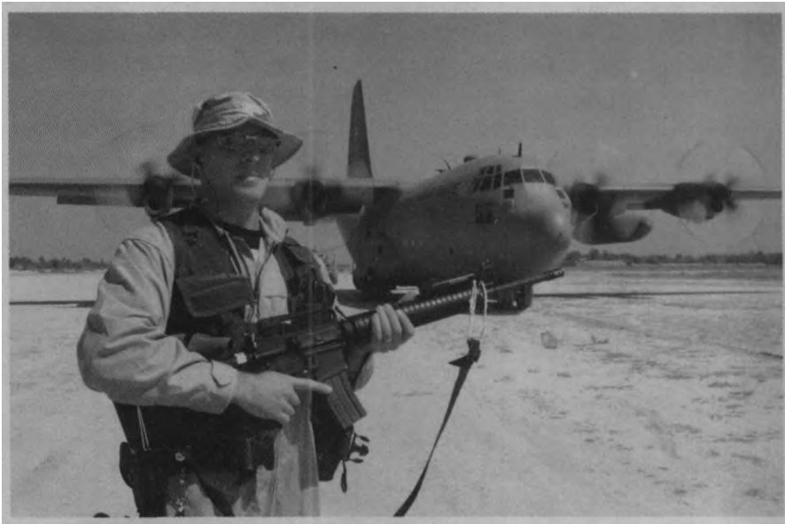
1 C-130战术运输机虽已使用多年，仍然是美军空中机动的主力机型。

用本地人打本地人，是美军惯用的作战方法之一，并且具有比较丰富的经验。美军在朝鲜战争中用南韩人打北韩人，在越南战争中用南越人打北越人，在海湾战争中用阿拉伯人打阿拉伯人，在科索沃战争中用科索沃人打塞尔维亚人，在阿富汗战争中用“北方联盟”打塔利班。这些战法都在不同的程度上取得了成功。在未来的对伊战争中，美军可能利用北部禁飞区中的库尔德人、南部禁飞区中的什叶派穆斯林（大部分在伊朗）和旅居国外的伊拉克反对派，协助其进攻伊拉克。目前，北面的库尔德人有武装力量8000多人，南面的什叶派有武装力量4万多人。这两股力量虽然人数不多，但影响力不可小视。此外，美军还可能在展开地面攻击的同时，策动伊军部队起义，里应外合，一起推翻萨达姆政权。 使用智能机器人，进行城区作战