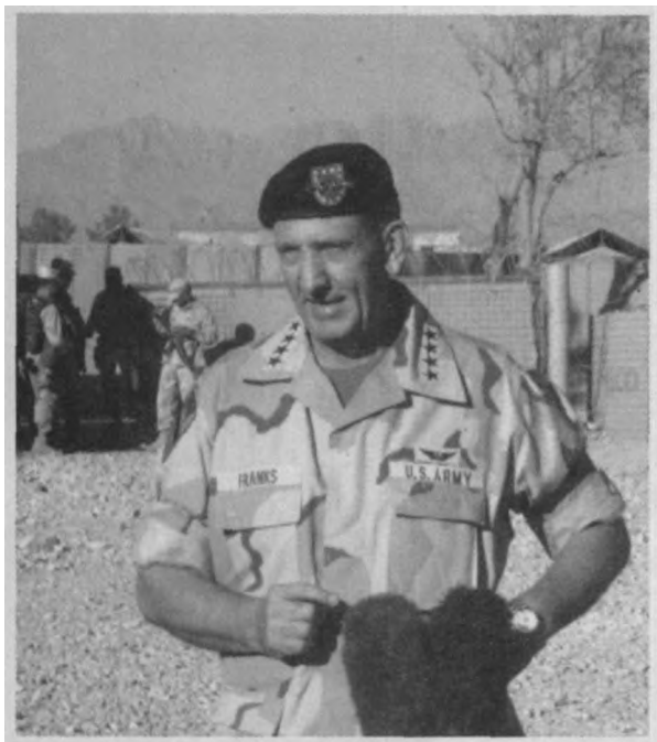
↑ 美军中央司令部的责任区包括伊拉克，其司令弗兰克斯在可能的战争中将发挥重要作用。