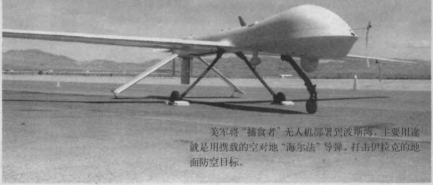
美军将“捕食者”无人机部署到波斯湾，主要用途就是用搭载的空对地“海尔法”导弹，打击伊拉克的地面防空目标。

美军是利用各种手段实施心理战的老手。在海湾战争中，美军通过电视、无线电广播和散发传单，成功地动摇和瓦解了伊军的抵抗意志。在多国部队的猛烈攻击面前，大批伊军放下武器、举手投降。在阿富汗战争中，美军一边投炸弹、一边投粮食和日用品、恩威并施，缓解了阿民众对美军的敌意。在未来的对伊战争中，由于目标是推翻萨达姆政权、扶植亲美政权，美军不仅会故伎重演，而且会变本加厉，更加重视心理作战手段的运用，把心理战贯穿战争全过程，为迅速结束战争和战后重建创造有利条件。