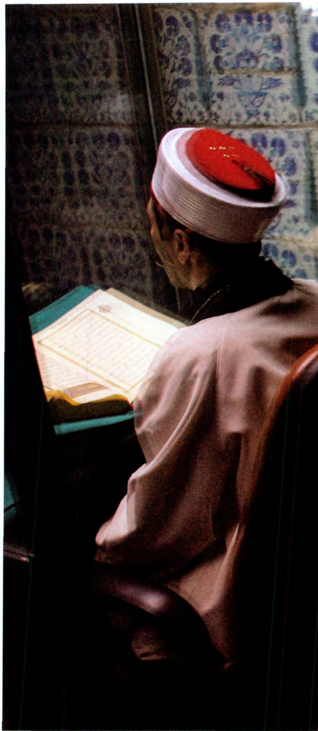
一个穆斯林阿訇坐在托普卡匹皇宫里。托普卡匹宫是奥斯曼帝国时期的皇宫，里面珍藏了许多珍贵的手工艺品，它是欧洲参观人数最多的博物馆之一，也是伊斯坦布尔最重要的历史古迹之一。（上图）

素材源于《数码精品世界》2010年第11期《伊斯坦布尔，第一眼就爱上他》；《商界·时尚》2010年第3期《为什么是伊斯坦布尔》等。