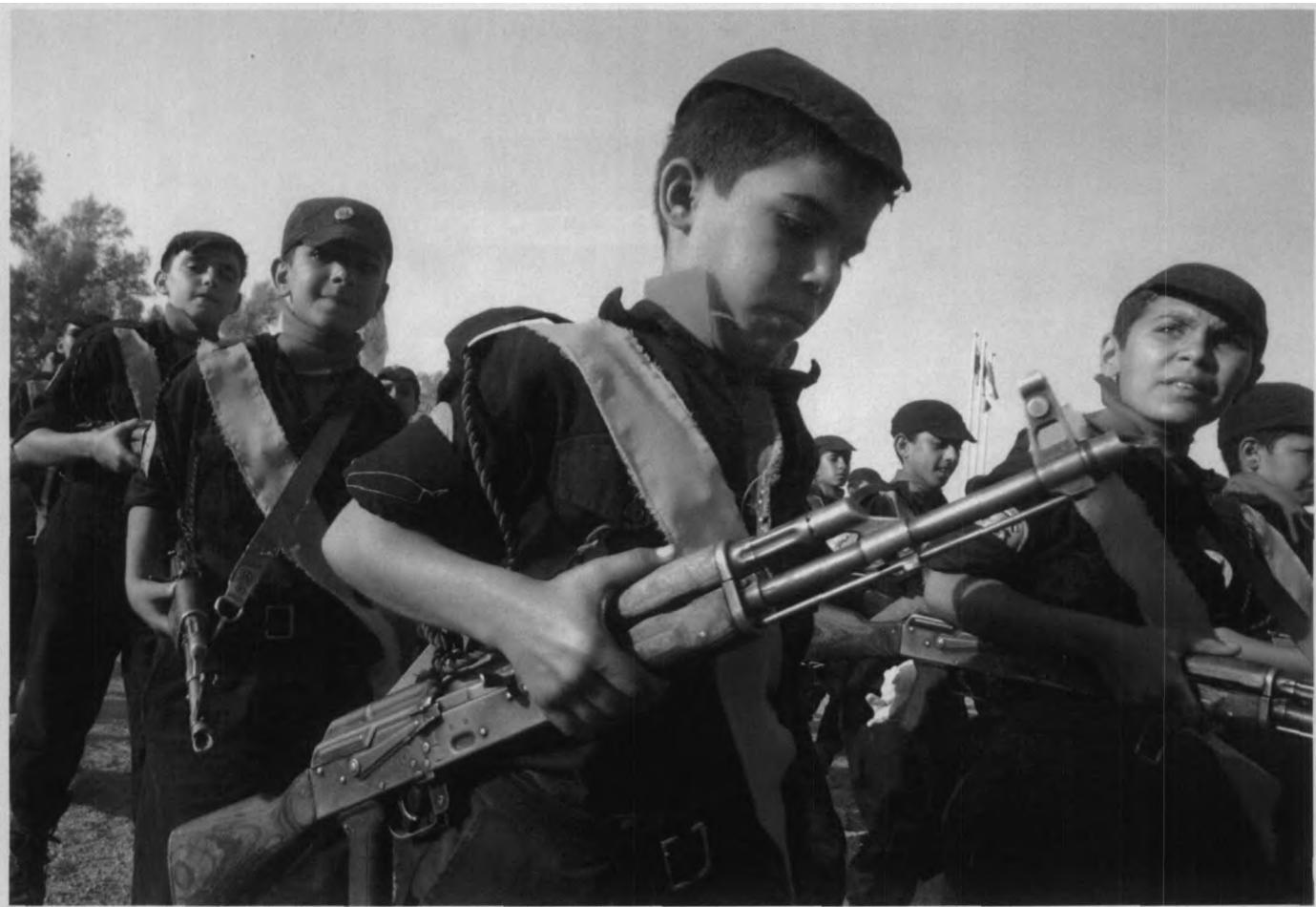
“萨达姆幼虎”：今年夏天，伊拉克政府对大批十几岁的孩子进行军事训练，使他们能在“不久的将来”参与保卫国家的战斗。