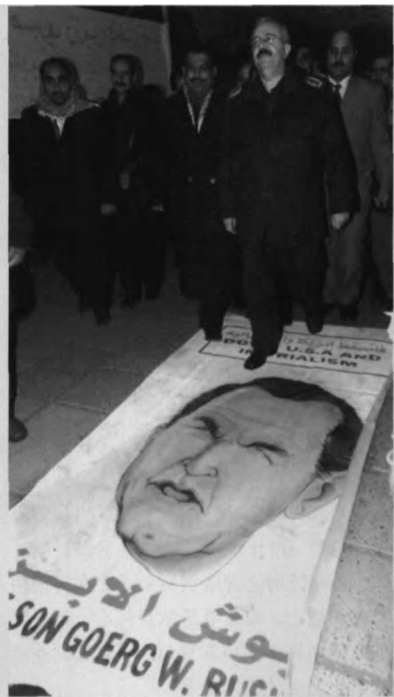
新版阿Q:在伊拉克纪念海湾战争11周年的一个公开展览中,美国总统布什的照片被铺在地上,让参观者践踏。伊拉克外长萨布里一马当先。

变数存在,事实上,现在的变数比任何时候都多。一是沙特和俄罗斯的态度。对美国来说,最大的噩梦便是沙特与俄罗斯联手对付美国。美国最希望看到的是俄罗斯与以沙特为首的欧佩克死掐,自己渔翁得利。于是我们便看到,当今年上半年俄罗斯决定逐步解除旨在削减原油出口的方针,从而与欧佩克的协调关系趋于崩溃时,布什很快乐地去了莫斯科。但现在却有些不妙,一面是俄罗斯叫停,一面是沙特反美热情高涨,并不排除在美国遇到能源问题时它们会踮上一脚。这也正是国际社会和美国国内最为忧虑的事情之一。布什在国内的支持率急速下降便很说明问题。