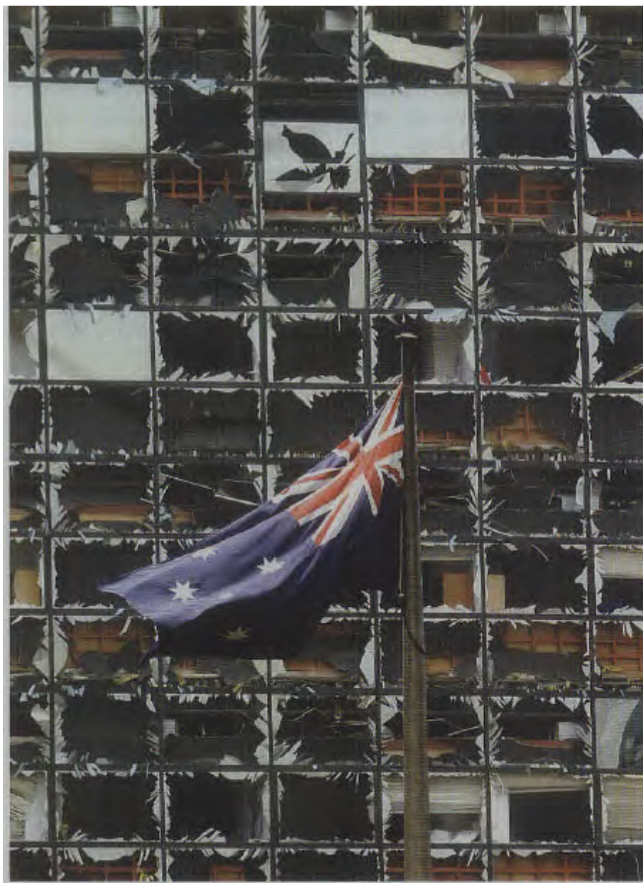
9月9日，澳大利亚驻印尼大使馆支离破碎。

其次，澳大利亚国民对政府的安全政策一直抱着一种嘲讽的态度，不管霍华德制定什么安全政策，国民都认为不妥。而在反对党方面，莱瑟姆也不想过多批评霍华德的政策，以避免过度冒犯美国。毕竟，假如莱瑟姆当选，他在很多方面仍需要美国的支持。出于各自的原因，两党都不想在安全政策问题上作太多文章。