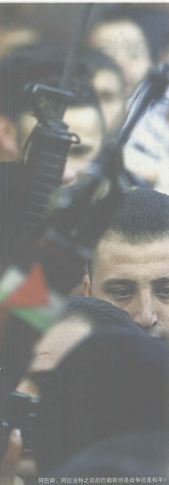
阿巴斯：阿拉法特之后的巴勒斯坦是战争还是和平？

支之多，这些武装力量各自为政，缺乏统一的领导。在2003年任巴自治政府总理期间，阿巴斯曾致力将这12支武装力量整编为3支，但由于和阿拉法特意见相左，阿巴斯最终选择了辞职，安全部队改革问题也就不了了之。