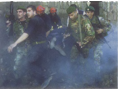
2月14日，哈里里和数名保镖一起，被炸死在行驶于贝鲁特市中心的车队中。

束以来最严重的一次袭击事件，同样的暗杀手法很容易让人联想到1989年被炸死的新当选总统勒内·穆阿瓦德。尽管内战结束了15年，无情的暗杀仍将继续成为黎巴嫩政治历史的路标。