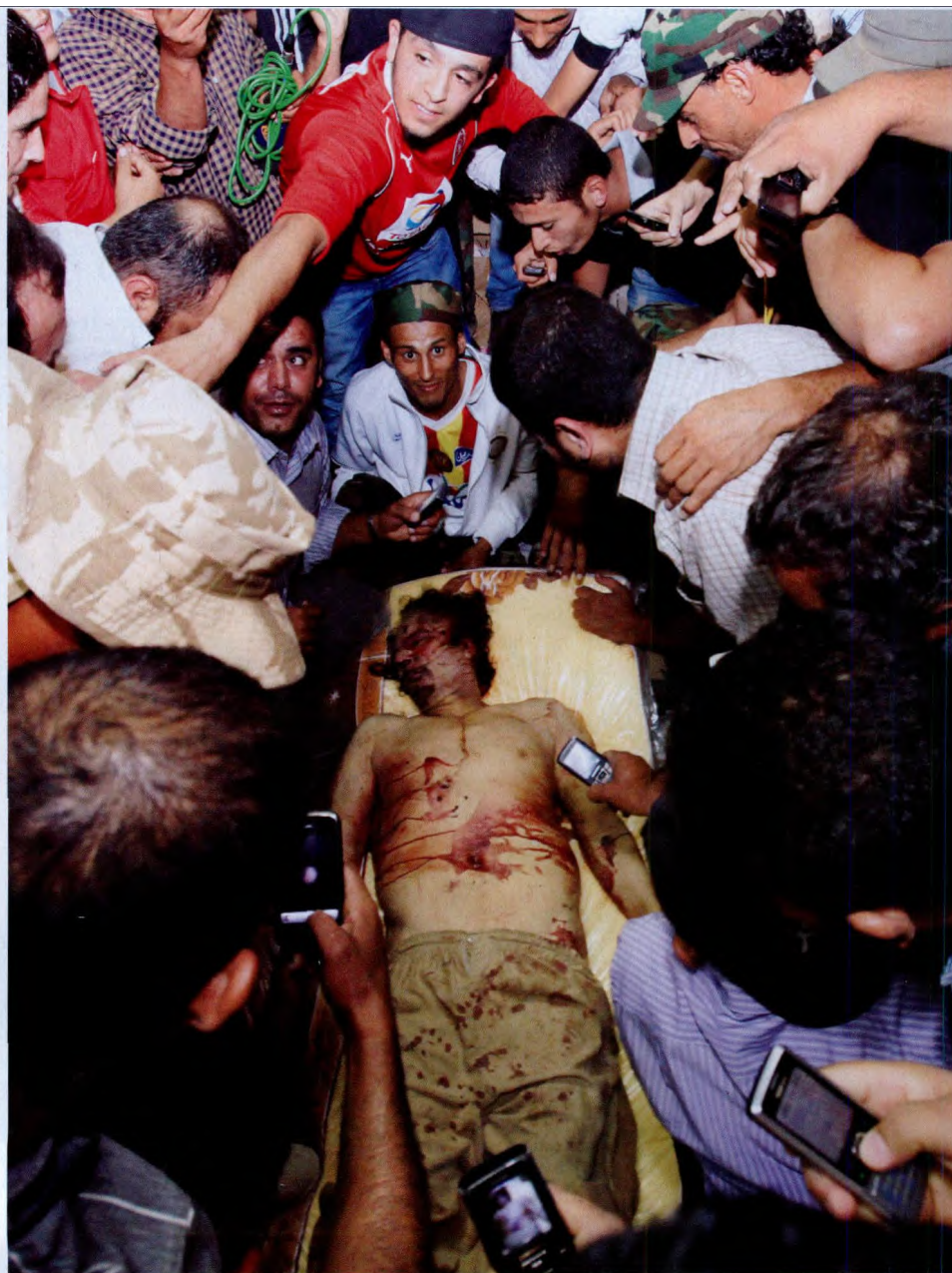
10月20日，在米苏拉塔市的一间房屋内，当地许多民众围赏卡扎菲的遗体拍照。

两个月以前，利过渡委面对人去楼空的阿齐齐亚兵营这样宣布：要等到利比亚全境战斗结束才会宣布解放，进而组建新政府。有评论认为，如果没有抓住卡扎菲，即使攻下首都、获得国际社会承认，利比亚的新一页也难以翻开。