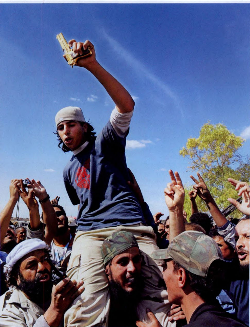
10月20日，在利比亚苏尔特，一些利执政当局的武装士兵为夺得了卡扎菲的金手枪而欢呼。