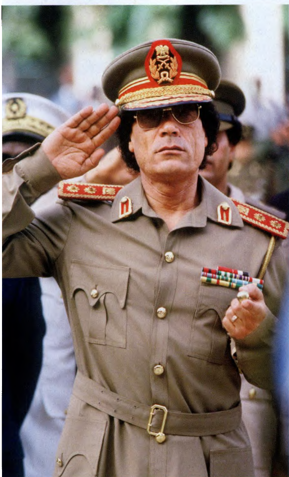
卡扎菲（1985 年）。执政利比亚 42 年的卡扎菲，以 7 个月的故事和 60 天的逃亡，结束了其人生的最后阶段。

在北京时间 10 月 25 日上午截稿之时，从利比亚传来消息：利比亚全国过渡委员