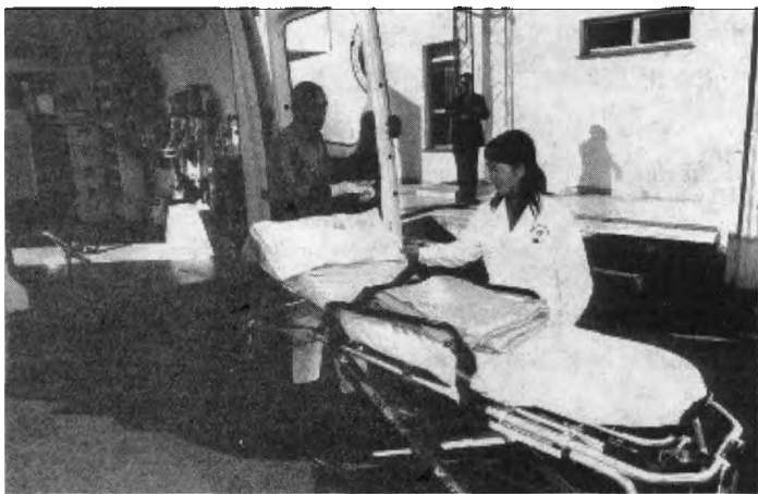
中方工作组迎候获救人员

在众人的注视下,载有29名获救员工的两辆中巴车驶离机场,前往酒店。他们抵达酒店后要做的第一件