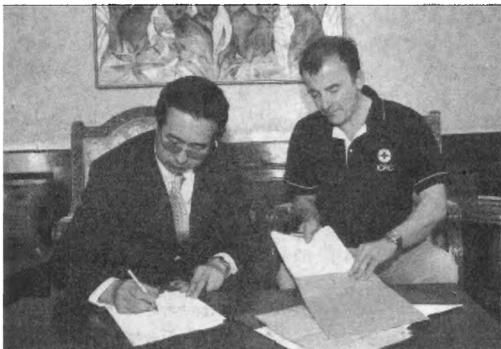
中方人员(左)和国际红十字会代表签署被劫持人员交换文件

经过中国政府和有关各方的不懈努力和沟通,1月28日在苏丹南科尔多凡州—阿公路项目营地被“苏丹人民解放运动北方局”武装劫持的29名中水电集团公司员工安全获释,并于当地时间2月7日17时35分抵达肯尼亚首都内罗毕。这起历时11天、牵动国人心弦的人质事件,终于得到圆满解决。