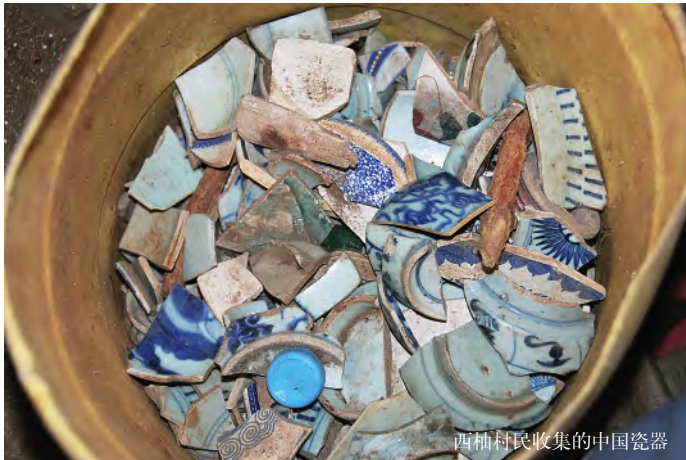
西柚村民收集的中国瓷器