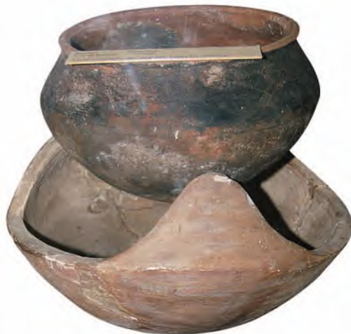
哥迪古城博物馆藏本地陶器

代青瓷片。另外,在《新唐书》、《通典》等文献中都有关于东非沿海地区的一些记载。这些都说明古代中国在唐代晚期与非洲东海岸的贸易往来和文化交流得到了一定的发展。