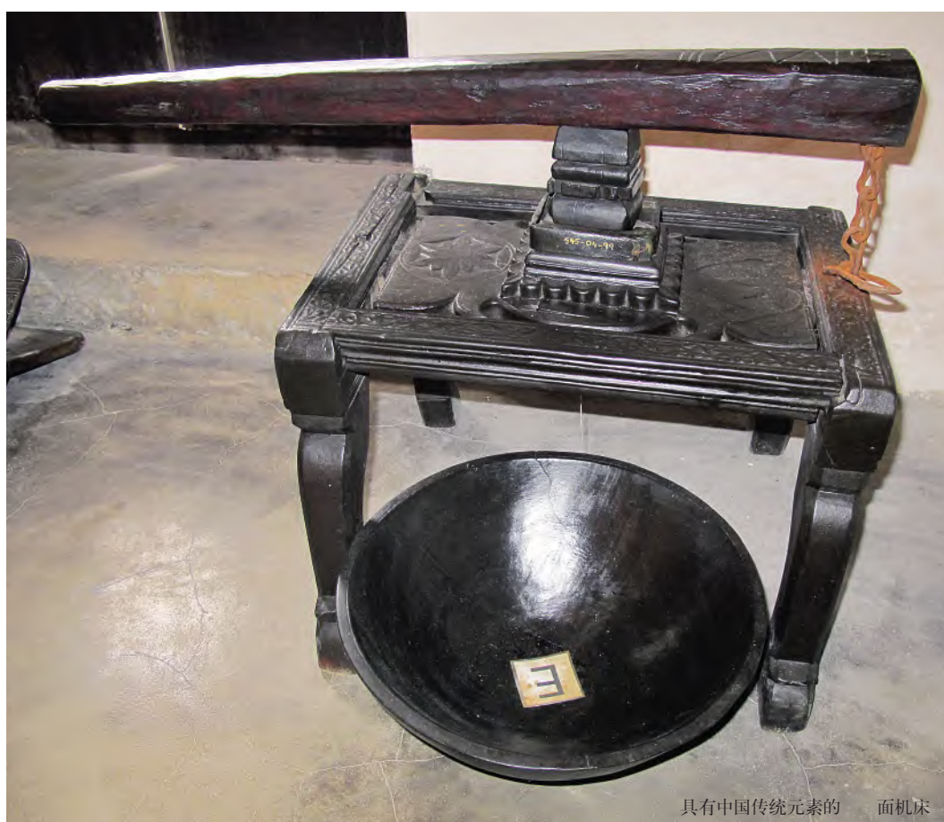
具有中国传统元素的 面机床

弓场纪知先生通过对埃及福斯塔特遗址出土的中国陶瓷器的整理研究，参考地中海其他地区的出土情况，提出了这样一些大胆的推测：他认为，福斯塔特遗址出土的唐代至北宋初期陶瓷器以青瓷和白瓷为主，包括中国北方磁州窑和耀州窑青瓷，很可能是在宁波、泉州、广州等港口集结后通过船只运往中东地区的。他还进一步考察认为，福斯塔特遗址始建于7世纪后半期，在9世纪通过红海交通大动脉而成为当时东西商业贸易发达都市。因此，同处非洲东部的肯尼亚沿海，与红海线路同