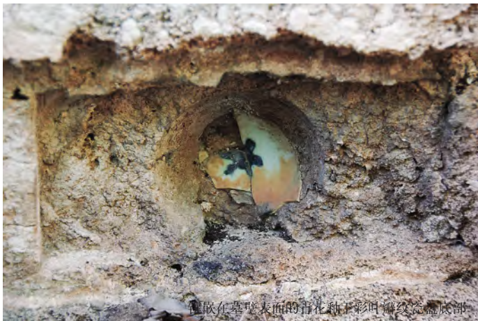
镶嵌在墓壁表面的青花釉彩团龙纹瓷盘底部