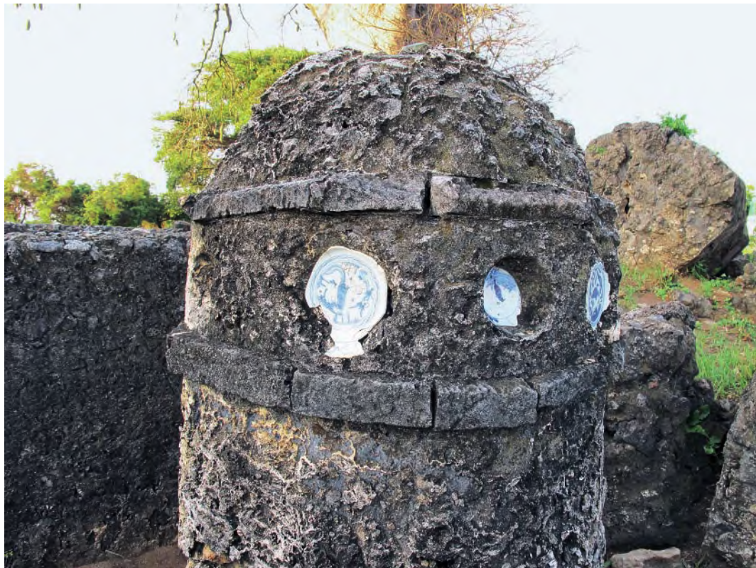
曼布鲁伊遗址柱墓镶嵌中国明代万历瓷器