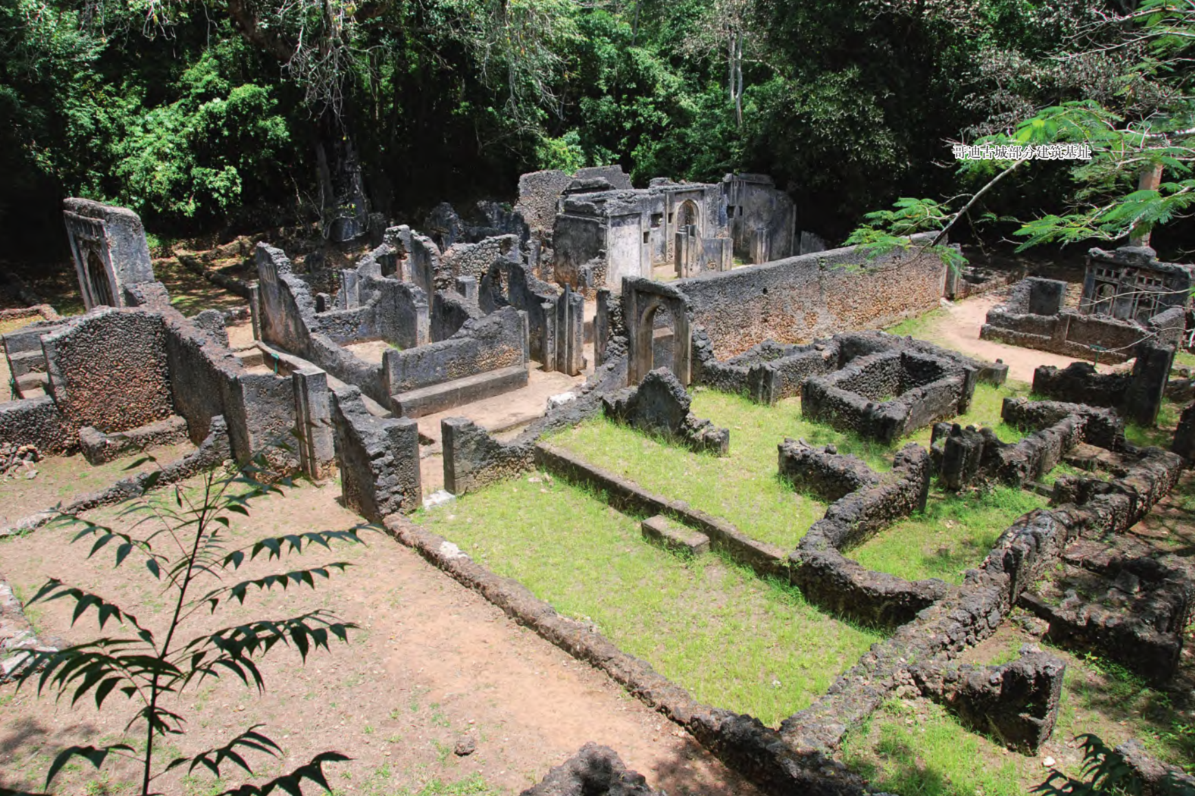
哥迪古城部分建筑基址