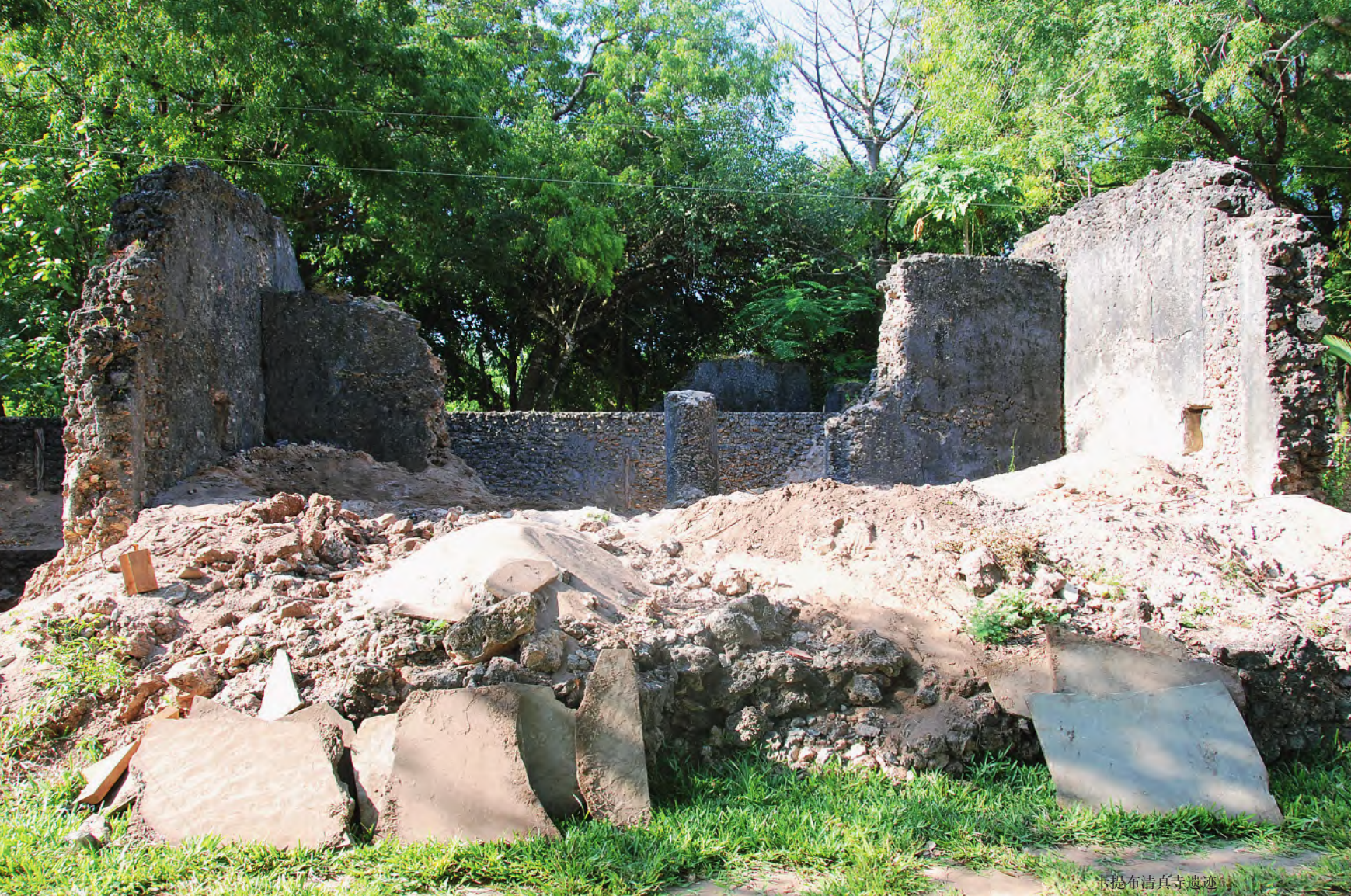
开罗布清真寺遗迹