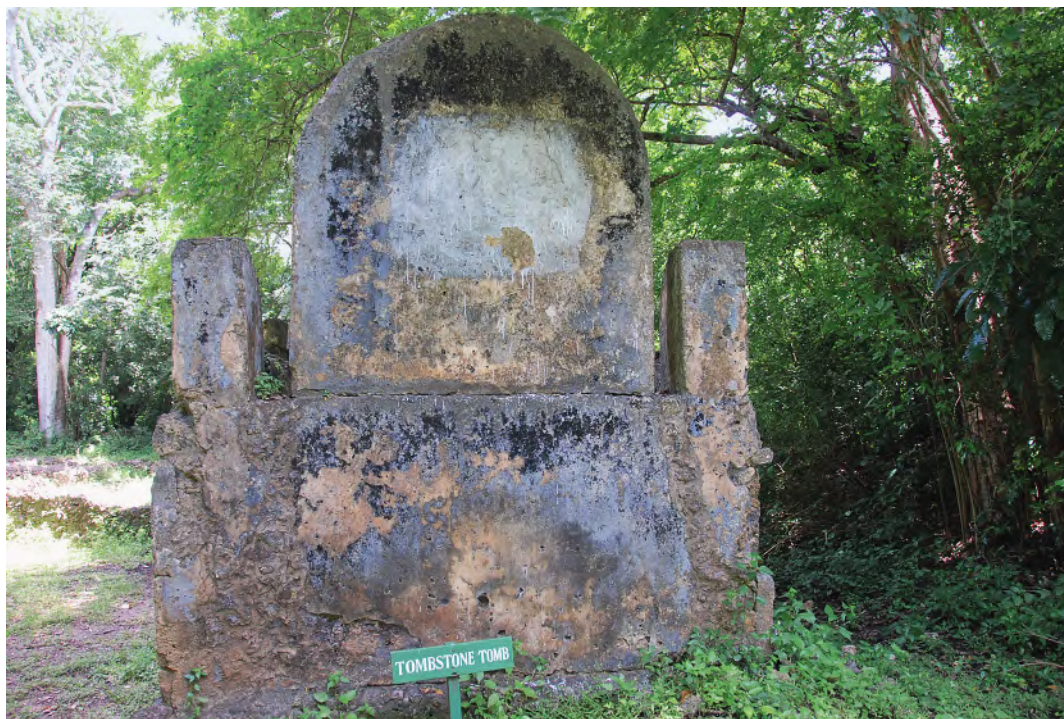
哥迪古城中的圆形墓碑

样重要,中非交流应当考虑约在9世纪已经比较繁荣的海上交通线路。另外,在索马里首都摩加迪沙还出土过“开元通宝”钱币。如前所述,在肯尼亚滨海地区已发现有多处遗址