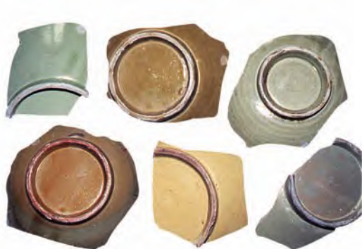
埃及福斯塔特遗址出土的中国唐至五代时期越窑青瓷