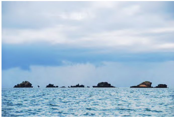
传说位于小曼达岛东南部的郑和沉船海域

据肯尼亚国家博物馆专家介绍, 曾在位于马林迪市白滩海滨的卡提布 (Khatibu) 清真寺遗址发掘出土过中国唐代 (约9世纪) 瓷片。又据我国陶瓷专家考察发现, 拉穆博物馆保存有唐代瓷器碎片, 当然, 瓷片过于碎小, 还不能确切判定为唐代遗物。位于北非的埃及福斯塔特遗址出土有大量唐