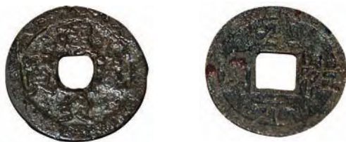
哥迪古城出土中国南宋铜钱“建炎通宝”