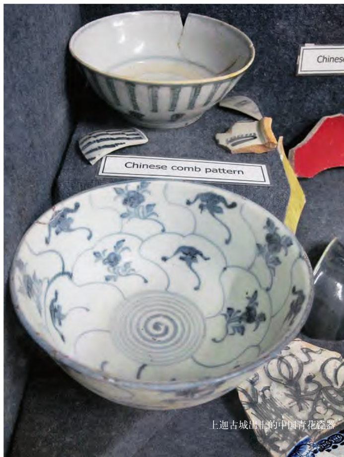
上迦古城出土的中国青花瓷器