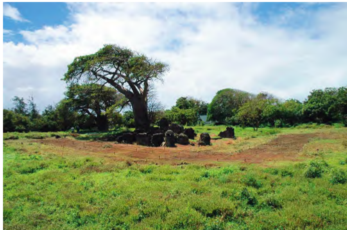
曼布鲁伊遗址发掘前风景