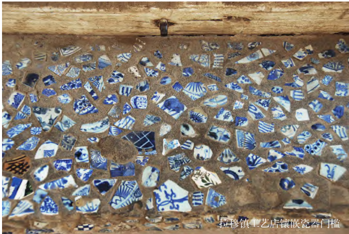
拉穆镇工艺品店镶嵌瓷器门槛