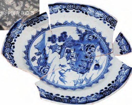
帕泰古城村民收藏的清乾隆时期青花瓷盘