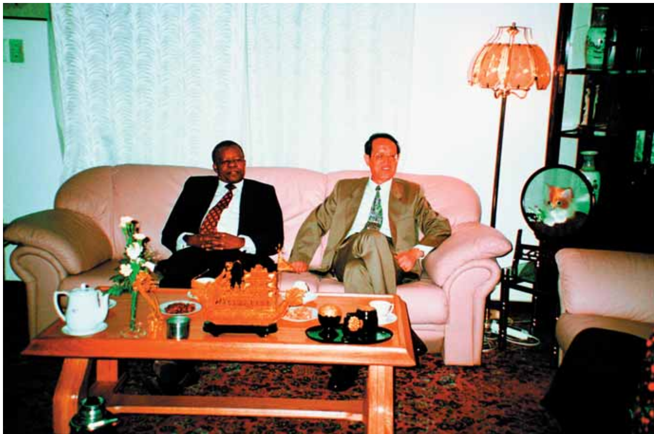
张世华大使设家宴宴请厄立特里亚现任总统伊萨亚斯全家后，他们在客厅畅叙友情。