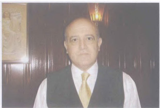
▲ 突尼斯驻华大使穆罕默德·萨赫比·巴斯里

埃及与中国合作开展了对苏伊士湾西北经济区的开发，该经济区是中埃两国经贸合作的一个重要项目。埃及期待能成为中国选择建立境外经济贸易合作区的第一个非洲国家，希望吸引中国企业前来投资。