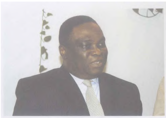
▲ 尼日利亚驻沪贸易专员巴德基·阿比克依

1943年，在尼日利亚中部乔斯高原边缘一个名叫诺克(Nok)的村庄，人们从锡矿水坑里掘出了一个