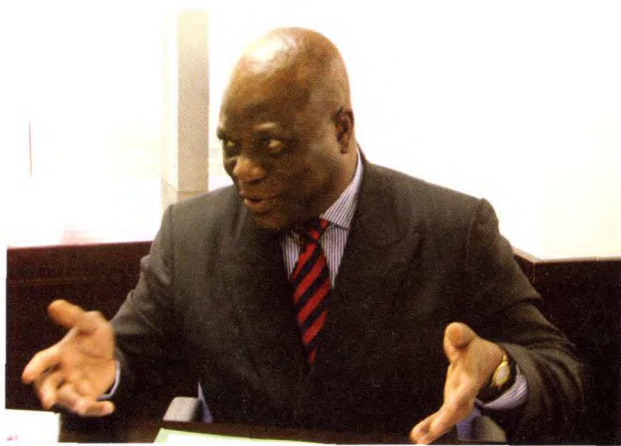
▲ 加蓬驻华大使艾玛努艾尔·姆巴·阿洛