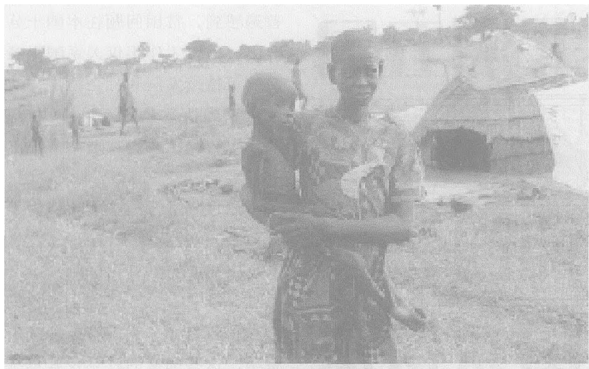
非洲贫困的妇女儿童

贫战略》框架文件,其目标是实现国内生产总值年均增长5.2%,2010年达到10%。刚劳党提出了“新希望”社会计划,制定了减贫战略文件,提出了经济增长和消除贫困的目标,并将党的新千年发展目标纳入国家发展的战略目标。