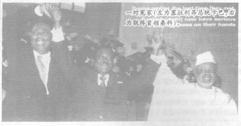
一对冤家(左为塞拉利昂总统卡巴,右为联阵首领桑科)。now have serious issues on their hands

联合国维和部队是根据安理会1999年10月决议,接替驻塞的西非维和部队负责监督停火和实施洛美协议,开始定编为6000人,今年2月安理会根据需要将它增至1.1万人,但实际上至今只有8500人。这支部队主要由非洲国家部队组