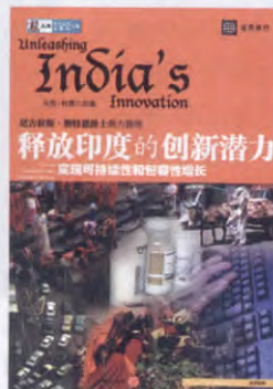
马克·杜茨 主编 中信出版社 2009年1月版

印度正迅速成长为全世界高科技产品与服务的领先创新者,相对于创新潜力,印度产业的长期竞争力和经济增长还不甚乐观。印度90%左右的工人在非正规经济部门工作,就业不充分、劳动生产率和技能低下是这一领域的特点。虽然印度拥有大量的年轻劳动力,25岁以下的人口占全国人口的一半多,但是25-30岁人口中仅有17%的人接受过中等教育。为促进经济的持续快速增长,削减贫困,印度需要积极发挥创新潜力,依靠新型的、迅速的包容性增长,完成经济和社会变革。