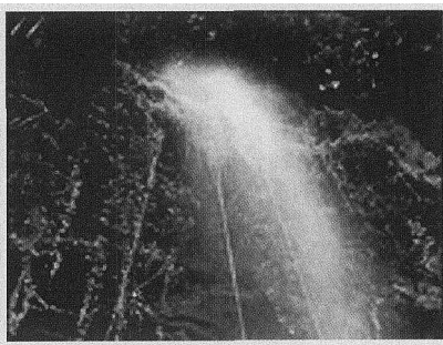
■ 著名的金迪亚“新娘面纱”瀑布

解决上述问题的主要措施是对主要经营者的政治思想和业务水平的培养教育,对其任期与业绩进行长远考虑,并适当赋予自主权,条件成熟时,可考虑成立驻几企业商会,加强交流,协调市场,避免国内同行之间恶性竞争。