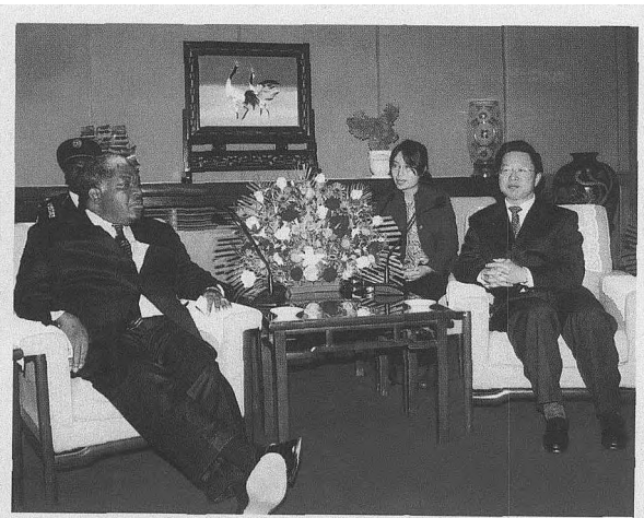
■ 中国贸促会副会长于平会见赞比亚总统姆瓦纳瓦萨。

另据了解,东南非共同市场组织目前正在同联合国开发计划署联手,在赞比亚、埃塞俄比亚、乌干达和坦桑尼亚四国就橡胶种植的潜力进行调查,准备帮助这些国家发展橡胶树种植和橡胶加工技术。赞比亚气候适合种植橡胶树,而且已经有了一些胶林。中国作为世界主要橡胶生产国,在橡胶树种植及橡胶产品加工方面有丰富的经验,有实力的中国企业可以主动参与赞比亚的橡胶资源生产与开发。