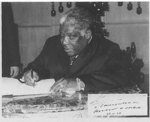
■ 赞比亚总统姆瓦纳瓦萨为中国贸促会题词。

更为重要的是赞比亚土地资源丰富,土地使用价格便宜,农业服务体系健全,农资的价格较低,而且赞比亚主要粮食作物如小麦、玉米,价格均高于我国国内市场,遇到天灾减产,更是大幅涨价。因此,在赞比亚投资农业开发回报率较高。目前,赞比亚全国共有66700家外国农场。其中,中资农场4家,均已取得了较好的经济效益。据了解,我驻赞比亚使馆等部门已设想了一个面积达1万公顷的对赞农业开发计划,估算总投资约2200