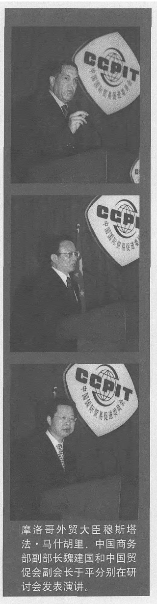
摩洛哥外贸大臣穆斯塔法·马什胡里、中国商务部副部长魏建国和中国贸促会副会长于平分别在研讨会发表演讲。

中国贸促会副会长于平在研讨会上说，中摩两国经济互补性很强，中国的轻工、家电、通讯、信息、电子等优质产品在摩洛哥有很大市场潜力，双方应加强企业间的沟通与合作。中国贸促会将积极促进双方企业的合资、合作，进