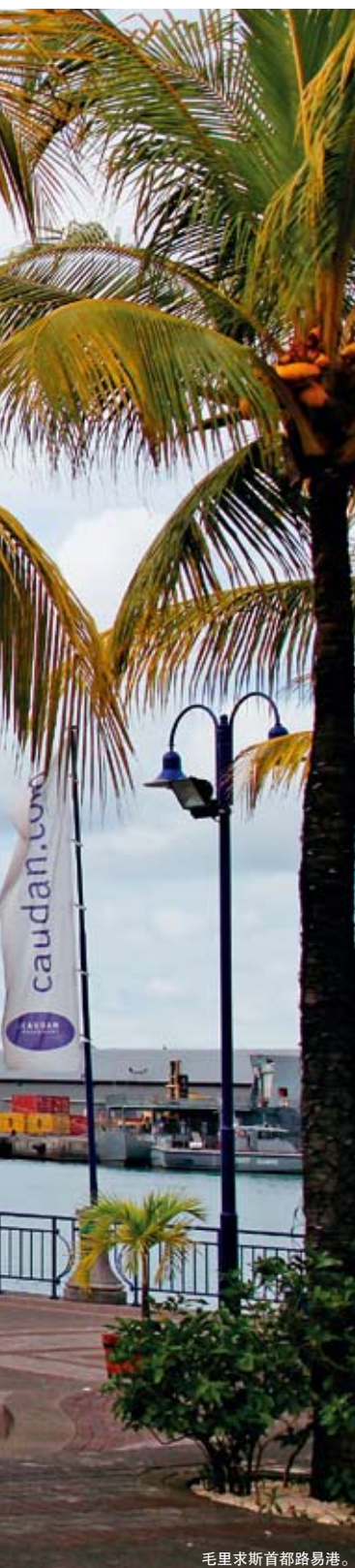
毛里求斯首都路易港。