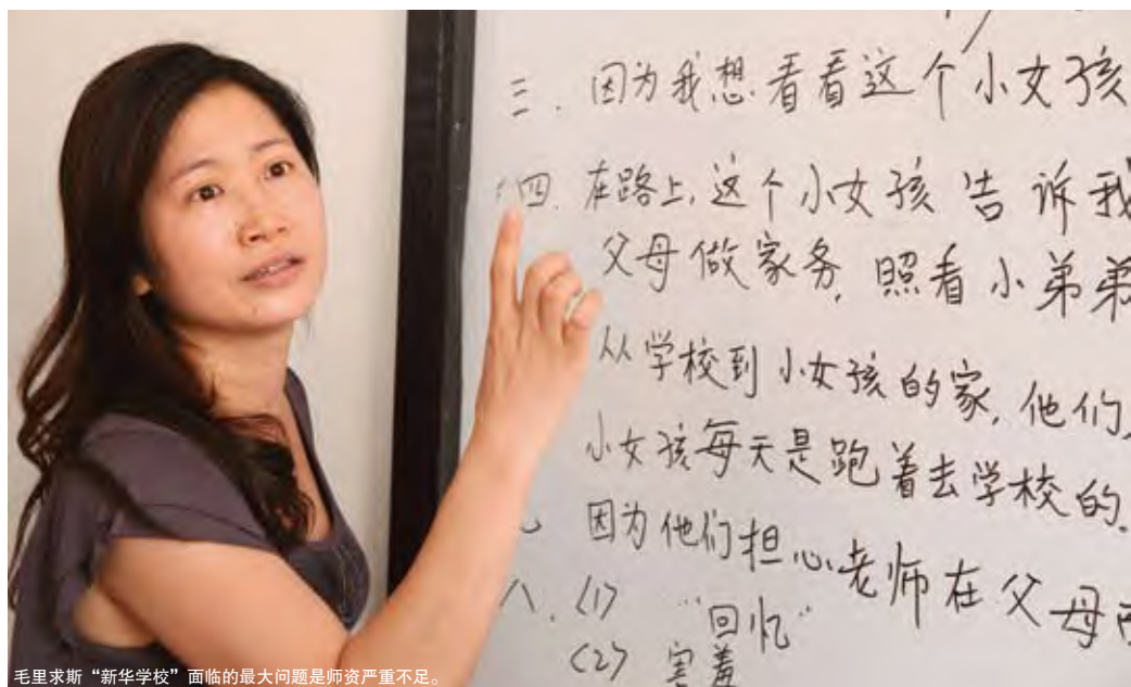
毛里求斯“新华学校”面临的最大问题是师资严重不足。

如今，毛里求斯中国文化中心的影响力已经走出毛里求斯这个天堂般的小岛。从去年开始，王永健不断接到附近地区和国家的邀请，希望能有中国文化展示或培训项目到那里去。他告诉我们，中心与塞舌尔等国家已经充分沟通，不久后一些适合巡回展示的文化活动不仅在毛里求斯举行，同时还会为尚未设立中国文化中心的临近国家和地区带去“中国风”。