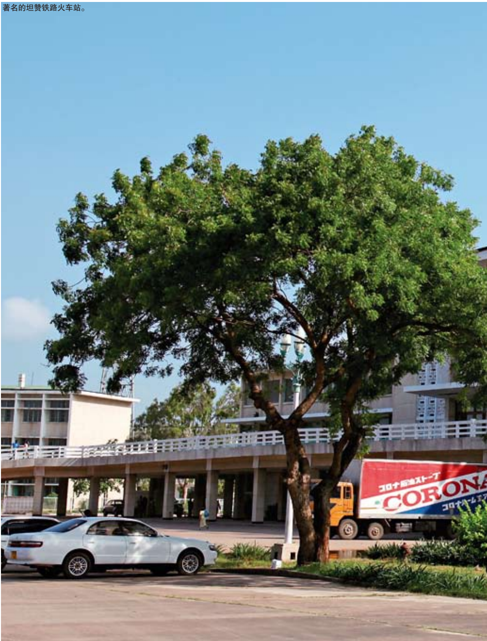
著名的坦赞铁路火车站。

高教发展合作项目的协议，中方据此先后为达累斯萨拉姆技术学院援建材料实验室和计算机实验室并派出多期教师于该校任教。中坦签有中方向坦方派遣医疗队协议，迄今已向坦方派出医疗队员1484人（次）。截至2006年底，中方共为坦方培训各类人才529人。自2001年6月以来，中方在专项贷款项下为坦赞铁路局累计培训77名技术人员和20名高级管理人员。