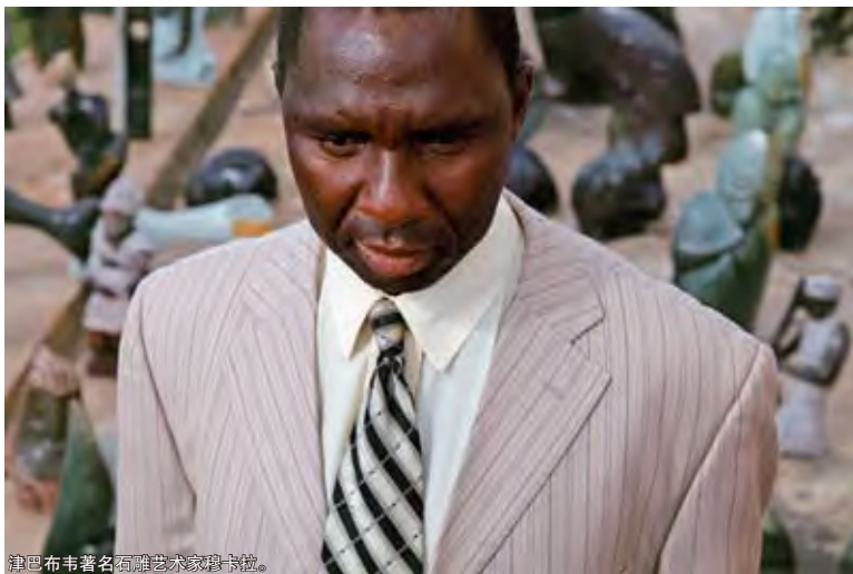
津巴布韦著名石雕艺术家穆卡拉。