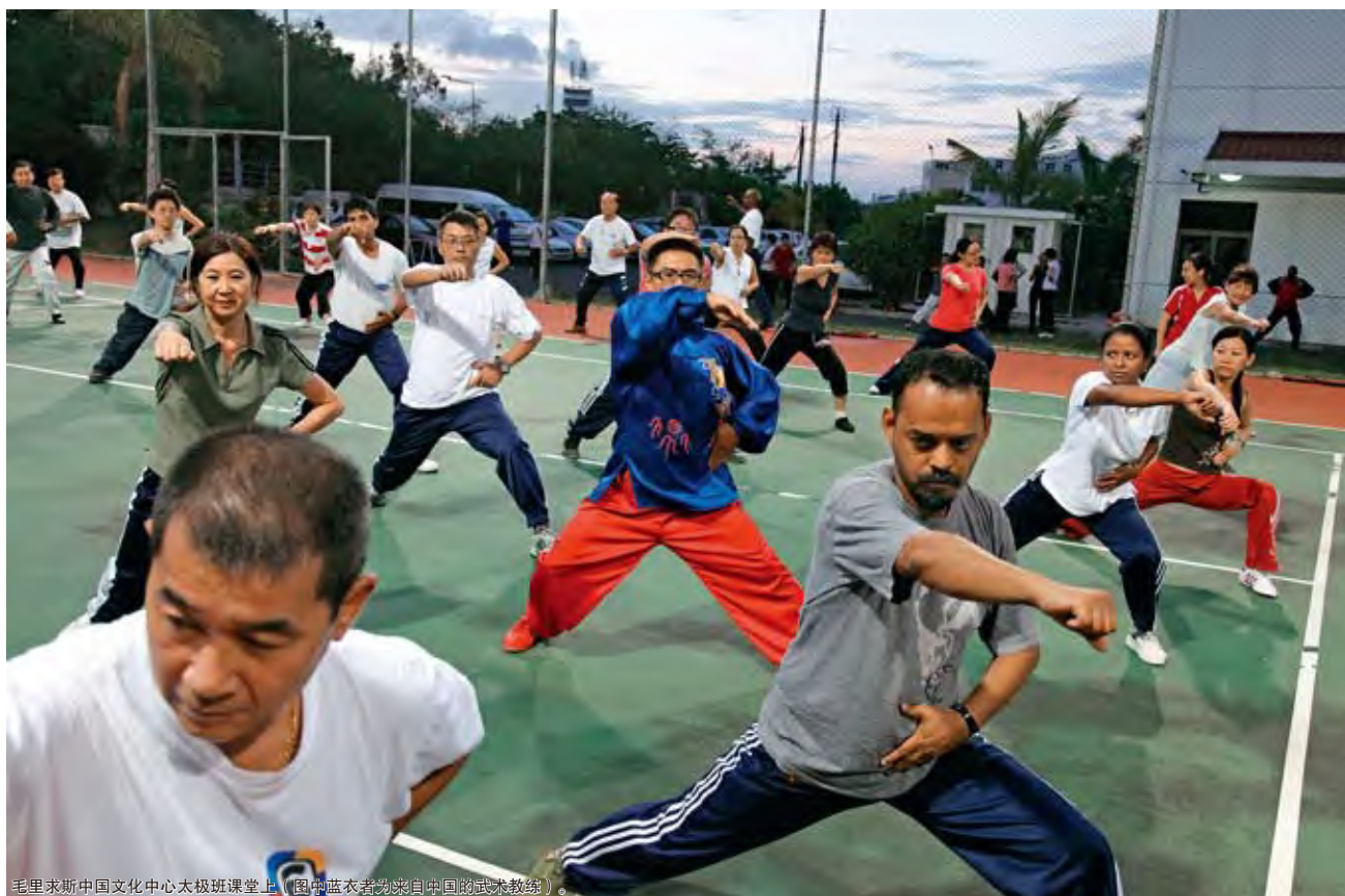
毛里求斯中国文化中心太极课堂上（图中蓝衣者为来自中国的武术教练）。