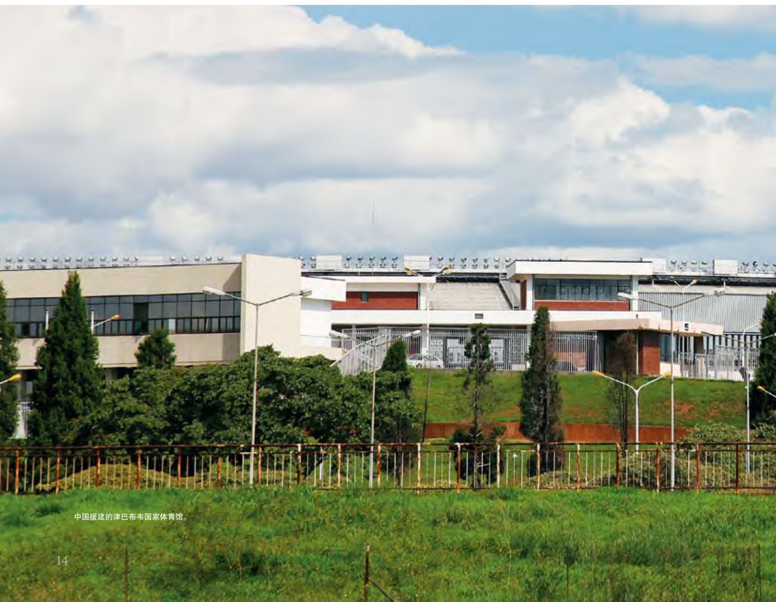
中国援建的津巴布韦国家体育馆。