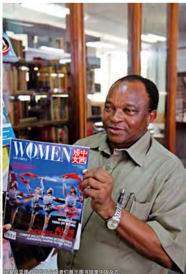
坦桑尼亚图书馆馆长向记者们展示图书馆里中国杂志。

外，我还看到了风筝、泥人张和内画壶。中国人太伟大了，身边的任何东西在他们手中都可以成为艺术品。”芙内拉表示，非常喜爱自己得到的一个泥人张的泥塑，摆在办公桌上每日欣赏。“同时，我得到了一个美丽的内画壶，我在想，要是坦桑人能将自己当地绘画融入鼻烟壶艺术就好了。”芙内拉认为，“欢乐春节”已成为当地的著名文化品牌，同时也是中坦文化交流的一种良好形式，它为两国人民搭建起一座彼此更多了解的桥梁。