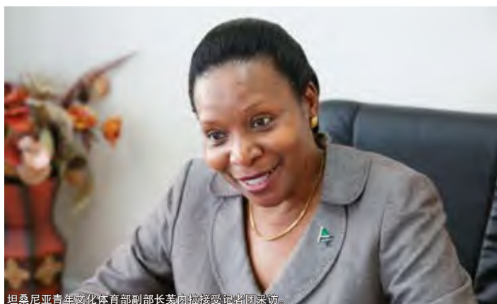
坦桑尼亚青年文化体育部副部长芙内拉接受记者团采访。