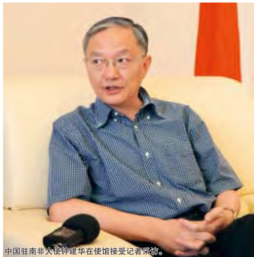
中国驻南非大使钟建华在使馆接受记者采访。

钟建华大使还表示，中非文化交流目前还处于浅层，往深处发展尚有难度。受制于文化差异，双方无论语言方面还是思维结构都相差巨大。因此，现阶段只能以舞蹈、杂技等无须语言沟通的形式进行交流。他透露，南非大使馆举办的数次电影节，效果比较一般，双方很难达到心灵的沟通与交流。对此他认为，“文化发展是一个过程，恐怕要几代人才能有成果，不能操之过急，也不用过高期待”。而且，他强调中国在向非洲介绍自己文化时，也要以平等的心态吸收对方的优秀文化：“对外文化交流要有真正谦虚、谨慎和尊重对方的态度。交流不是教化，交流的目的之一是让自己在交流中变得更好、更完善；所以，交流要有反身相看、互相欣赏的心态。”