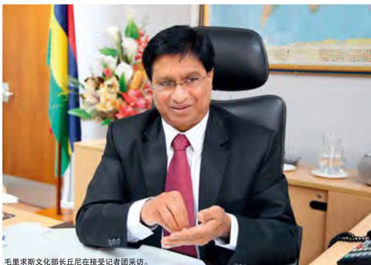
毛里求斯文化部长丘尼在接受记者团采访。