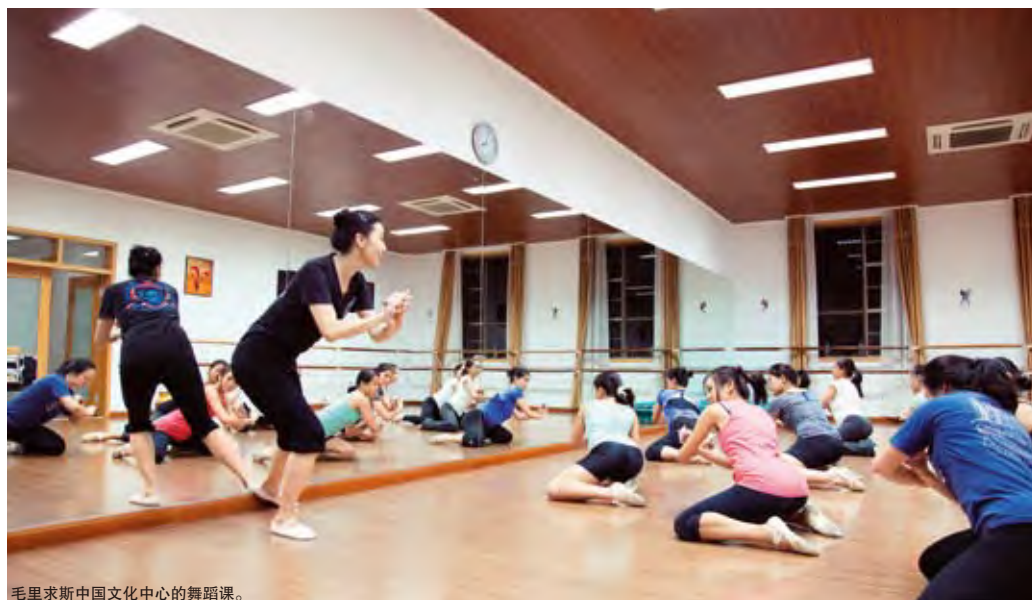
毛里求斯中国文化中心的舞蹈课。

丘尼高度肯定毛里求斯中国文化中心的的活动：“对于文化交流而言，中国在友邦开设文化中心是一种相当好的经验，值得向全世界推广，尤其在非洲国家，这会推动中非友好关系进一步发展，同时带动非洲在文化方面的进步，是一种双赢的做法。”