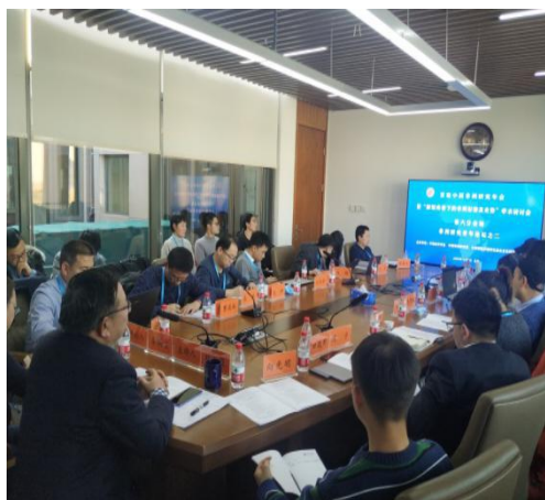
图为第六分会场现场